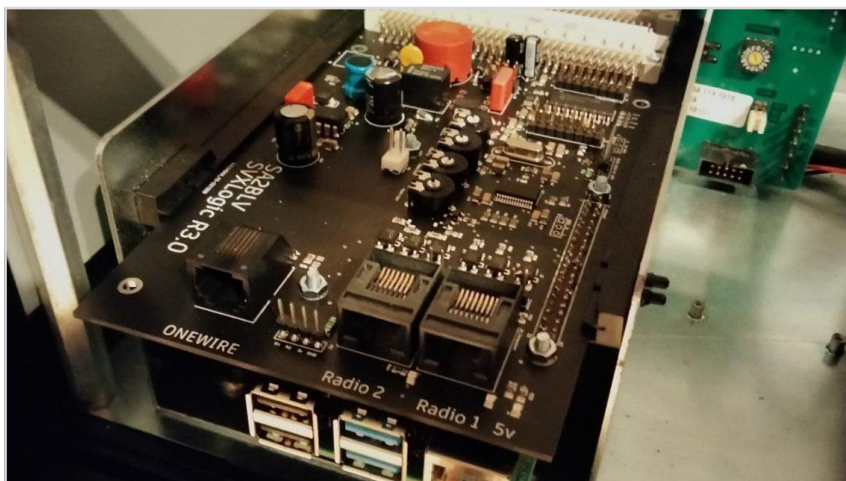
SA2BLV's kort, monterat inuti en Ericsson F800 repeater. Raspberry Pi skymtar undertill. Klicka på bilden för att läsa mera om kortet.

SA2BLV har redan sålt slut på sin första batch om 10 stycken färdigbyggda interface-kort.